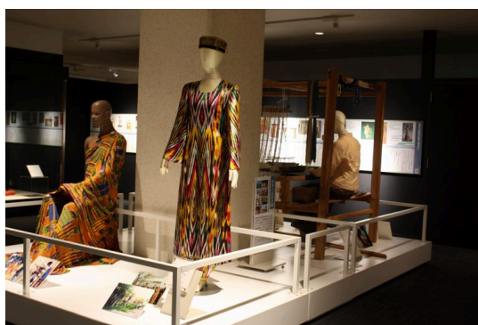
世界の民族衣装にはシルクが多く用いられています。それぞれのもっているシルクの美しい特色が鑑賞できるよう展示しています。 Silk is used often in a wide variety of native dress around the world. This exhibit provides a look at the unique and beautiful characteristics of silk material worldwide.