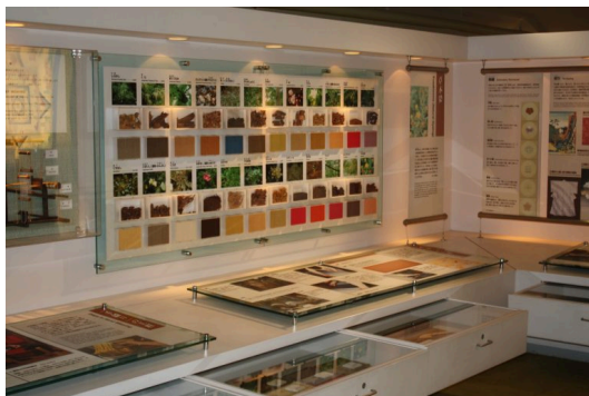
友禅や絞り染め、草木染めなどについて展示しています。 Learn about dyeing methods such as yuzen dyeing, tie-dyeing and plant-based dyeing,