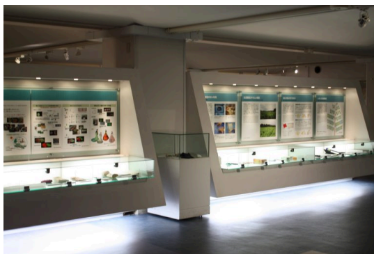
シルクの新たな可能性を紹介しています。 This area explores new possibilities in silk,