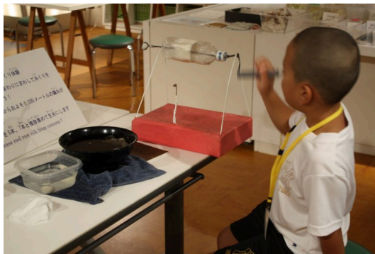
「糸繰り」や「はた織り」の体験ができます。（無料） Experience hands-on silk reeling and weaving (free of charge)