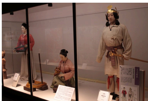
古代から現代までのそれぞれの時代において、衣装がどのようなかたちで私たち祖先に愛され、受け継がれてきたかを、時代考証のもとに復元して展示しています。