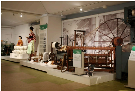
「かいこ」が作る「まゆ」から糸ができるまで、そして、織り、染めの様々な過程を展示しています。 This exhibit explores the process of silk production, from cocoon to thread, as well as the weaving, dyeing and other processes used to make finished products.